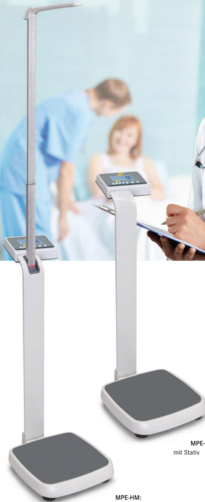
MPE-PM: mit Stativ